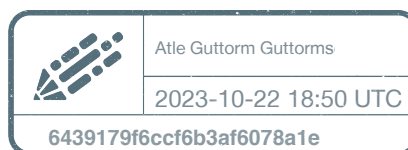
Atle Guttorm Guttormsen